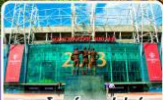
สนามโอลด์แทรฟฟอร์ด