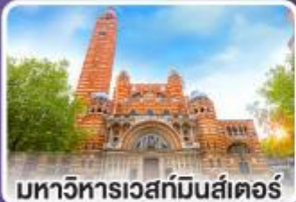
มหาวิหารเวสต์มินสเตอร์