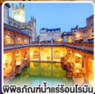
พิพิธภัณฑ์น้ำแร่ร้อนโรมัน

ตื่นตาตื่นใจ กับเสาศิรินสโตนเฮนจ์ 1 ใน 7 สิ่งมหัศจรรย์ของโลก