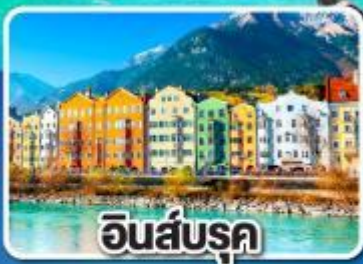
อินส์บรุค