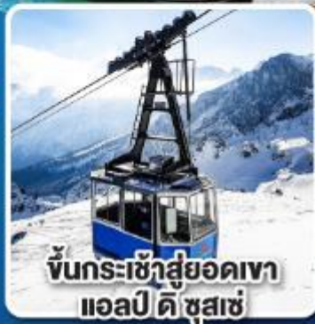
ขึ้นกระเช้าสู่ยอดเขา แอลป์ ดี ซูสแซ่

เที่ยวเมืองอินส์บรุค เพชรเม็ดงามสุดโรแมนติก แห่งแคว้นทิโรล