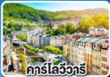
คาร์โลวีวารีย์