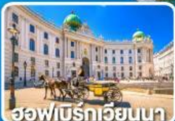
ฮอฟเบิร์กเวียนนา