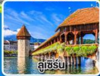
ลูเซิร์น

ชั้นรับสิทธิเข้าชมความงามของ ปราสาทนอยชวานสไตน์