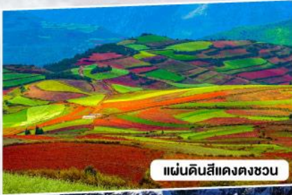
แผ่นดินสีแดงตงชว่น