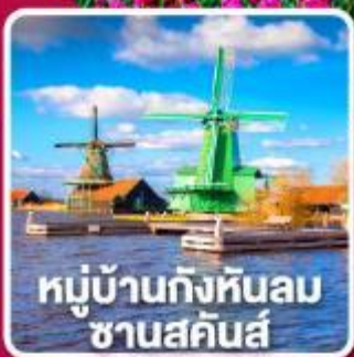
หมู่บ้านกังหันลม ซานสคินส์