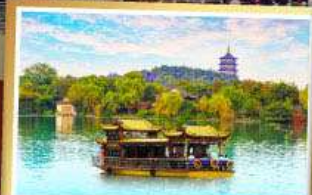
ล่องเรือทะเลสาบซีหู