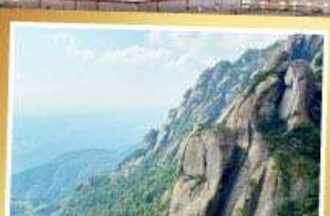
เขาหลิงซาน